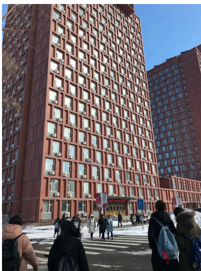
宿舍樓外觀（一共 20 層）