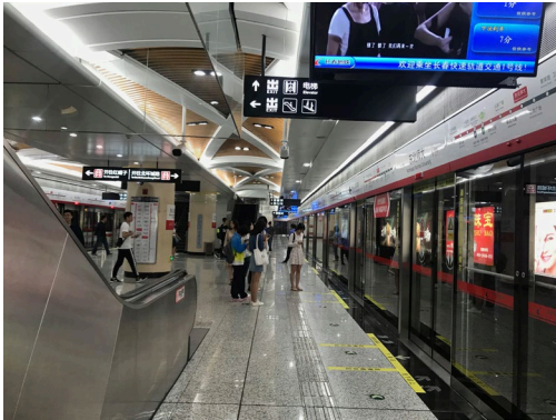
學校門口的地鐵站（因為長春的地鐵是去年新蓋的，所以很乾淨）