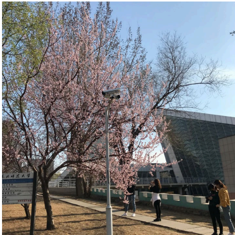
學校春天的時候會開很多花，很美