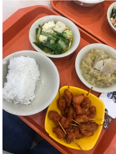
食堂基本菜的菜色（這樣不到 10 塊人民幣）